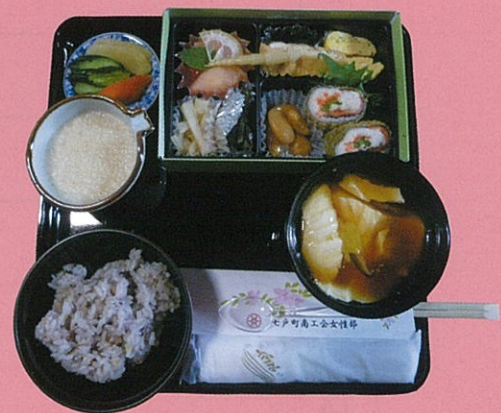
つつじまつり弁当 (写真はイメージです)

※全行程にボランティアガイドが随行します。 ※当日は歩きやすい格好でお越しください。