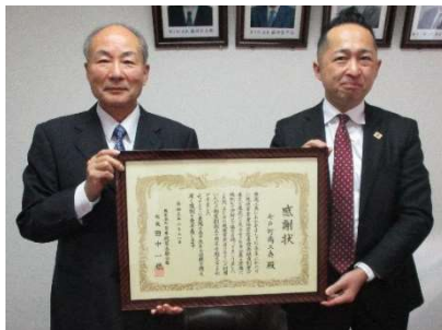
米内山会長（左）と北山事業統括（右）

日本政策金融公庫青森支店では、マル経済資制度50周年を記念して、令和5年10月30日、七戸町商工会館において、当商工会を表彰いたしました。