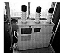
高圧コンデンサー