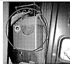
低圧コンデンサー ※主に店舗・作業場・倉庫等の壁や 配電盤に設置されています。