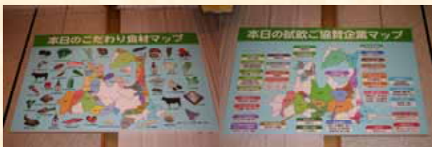
こだわり食材マップ・試飲ご協賛企業マップ

県内各地域の企業等から提供された飲料もズラリと並べられた。 酒類は23社から39銘柄、ジュースは6社、水は4社からそれぞれ提供され、試飲された。