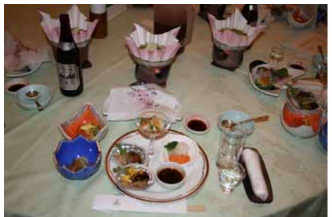
アワビやホタテ、各地の野菜など県産食材を生かした創作料理が披露された

わせ約百七十人が参加。県内商工会地域より集められた食材は和食（網野料理長）、洋食（久慈料理長）、中華（三上料理長）に姿をかえ南郷そばを合わせて全十品。会場には県内蔵元から提供された県産酒、ワイン、ジュースなどのコーナーが設けられ、参加者は海の幸、山の幸を使った創作料理と県産酒に舌鼓を打っていた。今後、参加された方々の意見を取り入れ、レシピ集を作成し、飲食店、宿泊業関係者へ無料で配布する予定となっている。