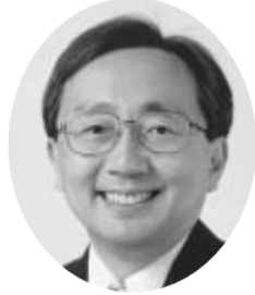
青森県知事 三村 申吾

の皆様には、常日頃から、商工行政の推進をはじめ、県政全般にわたって、格別の御理解とご協力をいただき、心から感謝申し上げます。