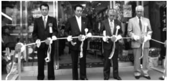
テープカットにより物産展開催