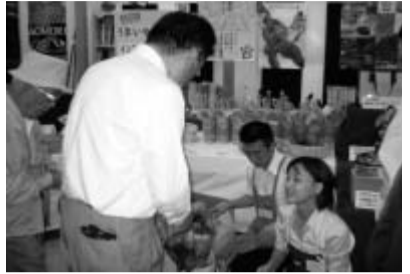
にぎわいを見せた会場風景

青森・秋田・岩手の北東北商工会連合会の共同開催による「むらおこし事業」の成果品を中心に北東北の物産品等を集めた第三回北東北広域連携物産展『みちのくうまいもの市』が10月1日より3日間、福岡市中央区天神のアンテナショップ「みちのく夢プラザ」で開催された。